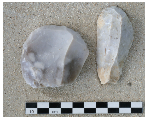
Grattoirs en silex Site de Sours

Le 17 septembre 2011 à partir de 16h30 seront inaugurés le panneau relatant la découverte archéologique (Place du D' Bouclet) et l'exposition des objets en salle de conseil. Cette exposition restera ouverte la semaine suivante.