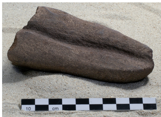
Galeats à rainures du Néolithique ancien Site de Sours