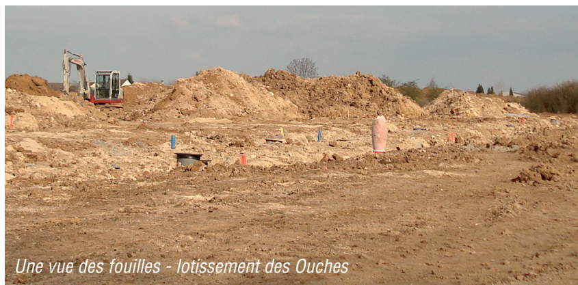
Une vue des fouilles - lotissement des Ouches

En effet, il y a 7000 ans, les premiers paysans de la région sont arrivés par étapes successives depuis l'Europe Centrale en passant par les Balkans, puis en remontant le Danube pour aboutir dans le nord de la France en passant par l'Allemagne et la Belgique ( vague danubienne). Certains se sont donc installés à Sours, étaient-ce les premiers habitants du village ?