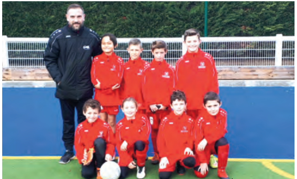
Équipe Jeunes U10-U11