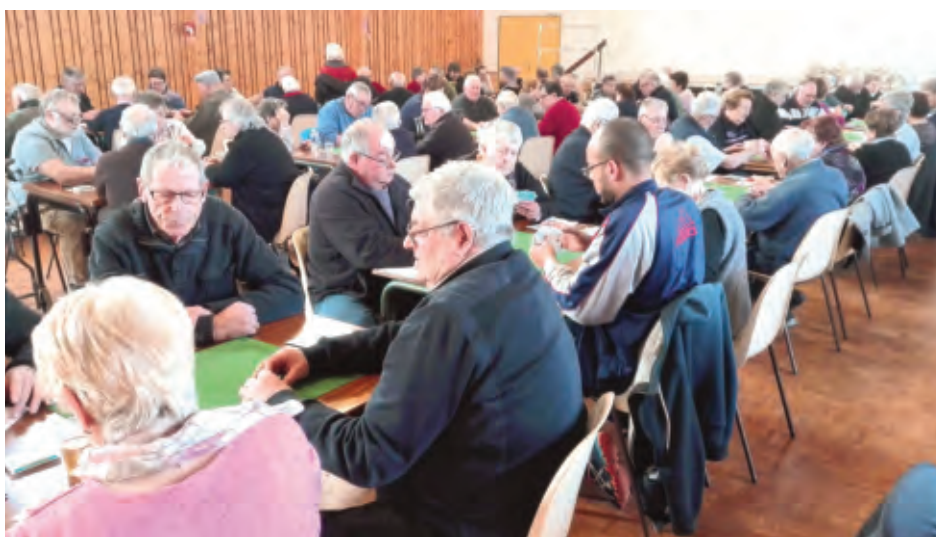
Concours de belote à la salle Denise Egasse