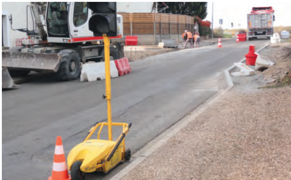
Installation des plateaux surélevés rue de la cigogne et rue saint mathurin