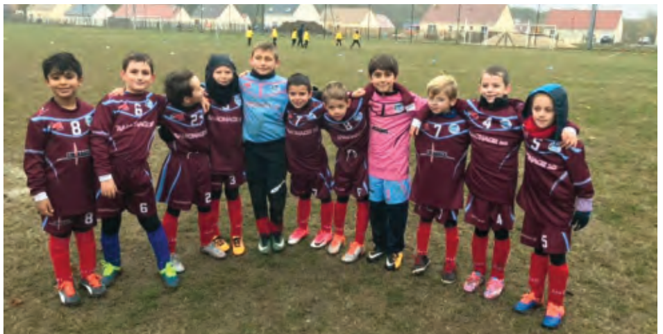
Équipe Jeunes U8-U9

Une saison coûte cher, un grand merci aux sponsors et aux subventions des collectivités. Les festivités organisées améliorent également les finances du club, nous comptons sur votre participation aux événements proposés par le club.