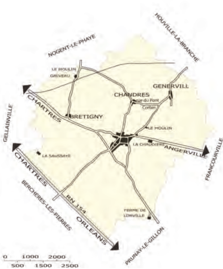
SOURS - Plan général