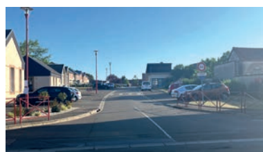
La rue Bouclet en centre-bourg