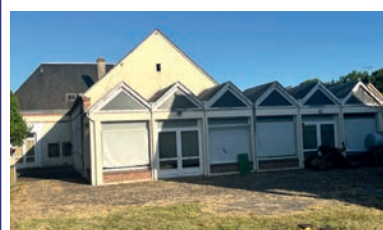
L'ancienne école de l'Eveil

• Autour des écoles , un parvis piéton sécurisé, des stationnements mieux organisés et une traversée plus sûre pourraient être envisagés.